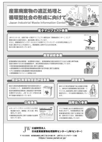
写真 展示ポスター

今後も、学会での発表等を通じて、広く関係者の皆さまに産業廃棄物の適正処理と循環型社会の形成に向けた業界の動向を周知し、ご意見をいただきたいと思いますと考えております。