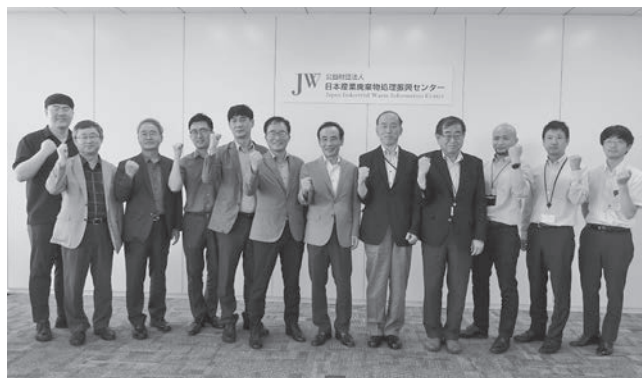
写真2 KECO等（左7名）からの来訪者