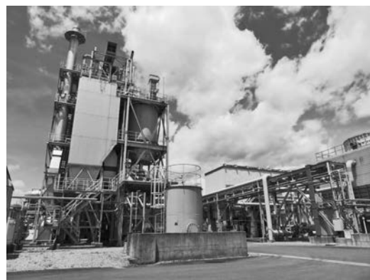
写真2 みやざきバイオマスリサイクル株 みやざきバイオマスリサイクル発電所