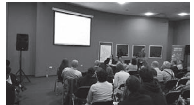
写真2 口頭発表会場の様子

口頭発表会場は100名規模の部屋（写真2）が7つ設けられていました。JWセンターからの発表は、2日目の午後「THERMAL WASTE TREATMENT」のセッションで「PRESENT STATE OF THERMAL TREATMENT OF MUNICIPAL WASTE AND INDUSTRIAL WASTE IN JAPAN」を行いました。内容は、都道府県政令市等へ実施した産業廃棄物焼却施設に関するアンケート調査の結果を取りまとめたもので、主に以下の点を報告しました。