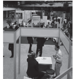
写真1 展示場の様子

発表はおよそ300題あり、多くのセッションで各種リサイクルを発展させた「サーキュラエコノミー」や開発途上国の「オープンダンピング対策」をキーワードとした研究内容が発表されているという印象がありました。