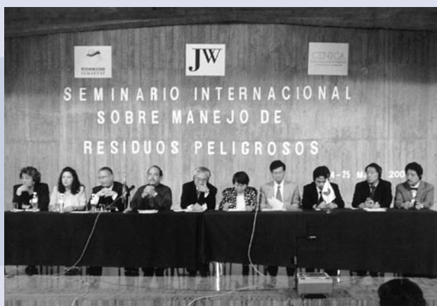
写真3 メキシコでの技術移転セミナー

メキシコ、日本の両国における産業廃棄物・有害廃棄物の法制度や処理状況に関する発表の後、中米でのバーゼル条約地域センターの活動状況、廃殺虫剤などの有害廃棄物の処理状況などに関する各国からの発表があり、2日間で合計14件の講演が行われた。会場はメキシコ環境庁の国際ホールで、参加者は160名に達した。セミナー終了後、廃油リサイクル施設の視察調査を実施した。