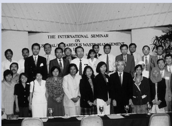
写真1 インドネシアでの技術移転セミナー

1998年2月に実施したフィリピンとわが国の二国間会議の協議結果に基づき、環境天然資源省環境管理局の協力を得て産業廃棄物・有害廃棄物国際セミナーが1998年12月にパサイ市で2日間にわたって開催された。（写真2）参加者は、フィリピン側が40名、日本側10名の計50名であった。初日と2日目の午前中は産業廃棄物や有害廃棄物の処理状況に関して、日本側からは、法制度と処理状況、ダイオキシン対策とPCB処理、アスベスト処理、プラスチック・リサイクルに関する4件の発表、フィリピン側からは有害廃棄物の法制度や現在の取組み状況に関する4件の発表があり、計8件の講演が行われた。2日目の午後は実際の処理状況を把握するため、サンマテオ最終処分場を参加者一同で視察した。セミナー終了後、半導体工場から排出される重金属含有汚泥から銅・鉛を回収する工場の視察調査を実施した。