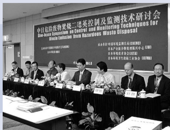
写真4 中国での技術移転セミナー

セミナーの翌日、日本側参加者一同により、天津市にある有害廃棄物処理施設の視察調査を実施した。