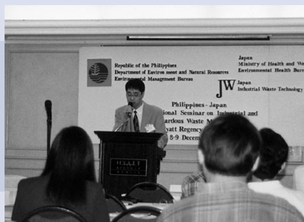
写真2 フィリピンでの技術移転セミナー