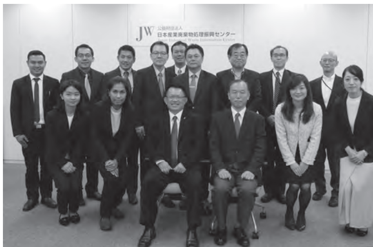
中央左側：タイ工業省副大臣（前列）、同省職員の方々、在日タイ大使館公使