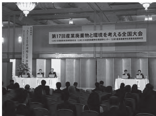
パネル討論会の様子